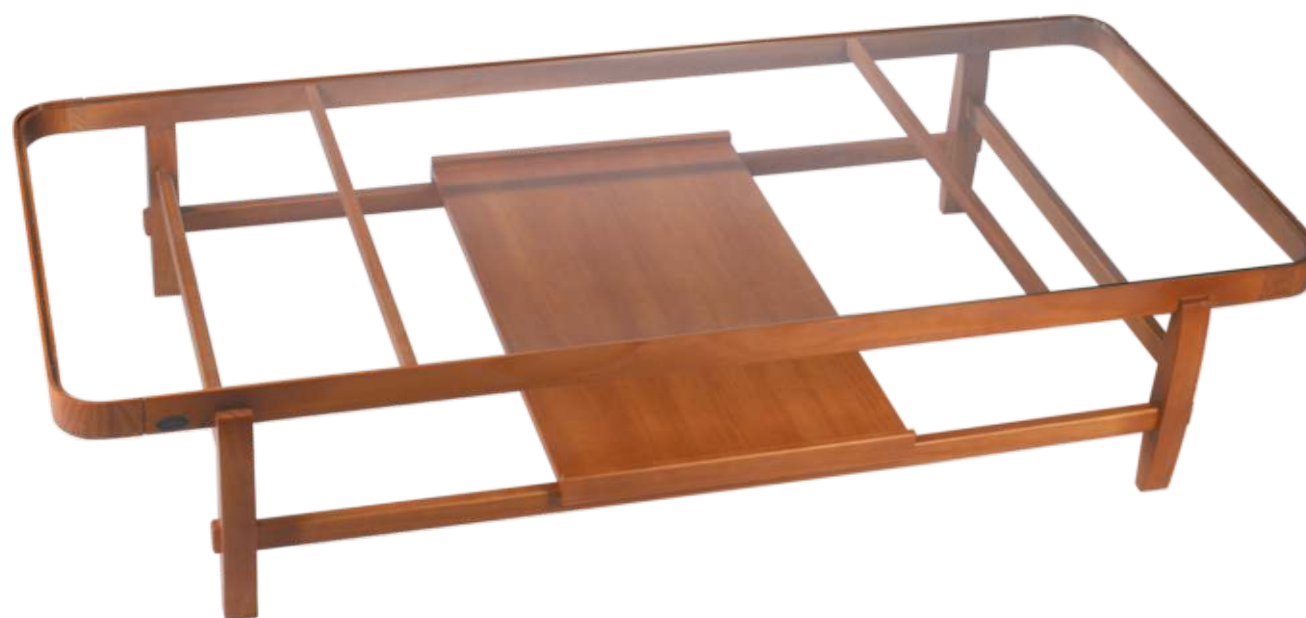
FOTO DO PRODUTO EM TROOI. PHOTO OF THE PRODUCT IN TROOI. FOTO DEL PRODUCTO DE TROOI.

CxPxA / medidas em mm LxDxH / measures in mm CxPxA/ medidas en mm