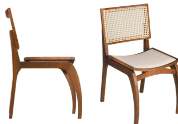
FOTO DO PRODUTO EM TR036. TECIDO 0014877. PICTURE UNIT IN TR036. FABRIC 0014877. FOTO DEL PRODUCTO DE TR036. TEJIDO 0014877.