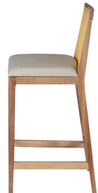
FOTO DO PRODUTO EM JEQUITIBÁ NATURAL TECIDO 0014877.PALHA ABERTA PICTURE UNIT IN WOOD JEQUITIBÁ, FABRIC 0014877.OPEN STRAW. FOTO DEL PRODUCTO DE JEQUITIBÁ NATURAL. TEJIDO 0014877.PAJA ABIERTA.