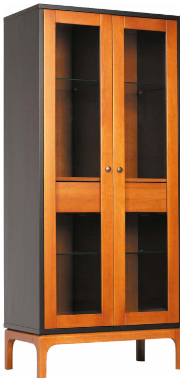
FOTO DO PRODUTO: PORTAS, PÉS E GAVETAS EM TRO01. CORPO EM TRO09. PICTURED UNIT: DOORS, LEGS AND DRAWERS IN TRO01. FRAME IN TRO09 FOTO DEL PRODUCTO: PUERTAS, PATAS Y CAJONES DE TRO01. CUERPO DE TRO09.

CxPxA / medidas em mm LxDxH / measures in mm CxPxA / medidas en mm