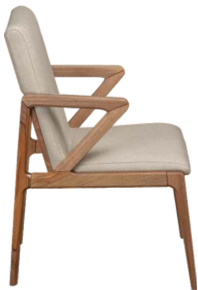
FOTO DO PRODUTO EM JEQUITIBÁ NATURAL TECIDO 0062618 PHOTO OF THE PRODUCT IN JEQUITIBÁ WOOD FABRIC 0062618 FOTO DEL PRODUCTO EN JEQUITIBÁ NATURAL TEJIDO 0062618