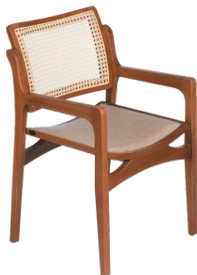
FOTO DO PRODUTO EM TRO01.TECIDO 0031011.PALHA FECHADA PICTURE UNIT IN TRO01.FABRIC 0031011.CLOSED STRAW. FOTO DEL PRODUCTO DE TRO01. TEJIDO 0031011.PAJA CERRADA.

FOTO DO PRODUTO EM TRO01. TECIDO 0031008.PALHA ABERTA PICTURE UNIT IN TRO01. FABRIC 0031008.OPEN STRAW. FOTO DEL PRODUCTO DE TRO01. TEJIDO 0031008.PAJA ABIERTA.