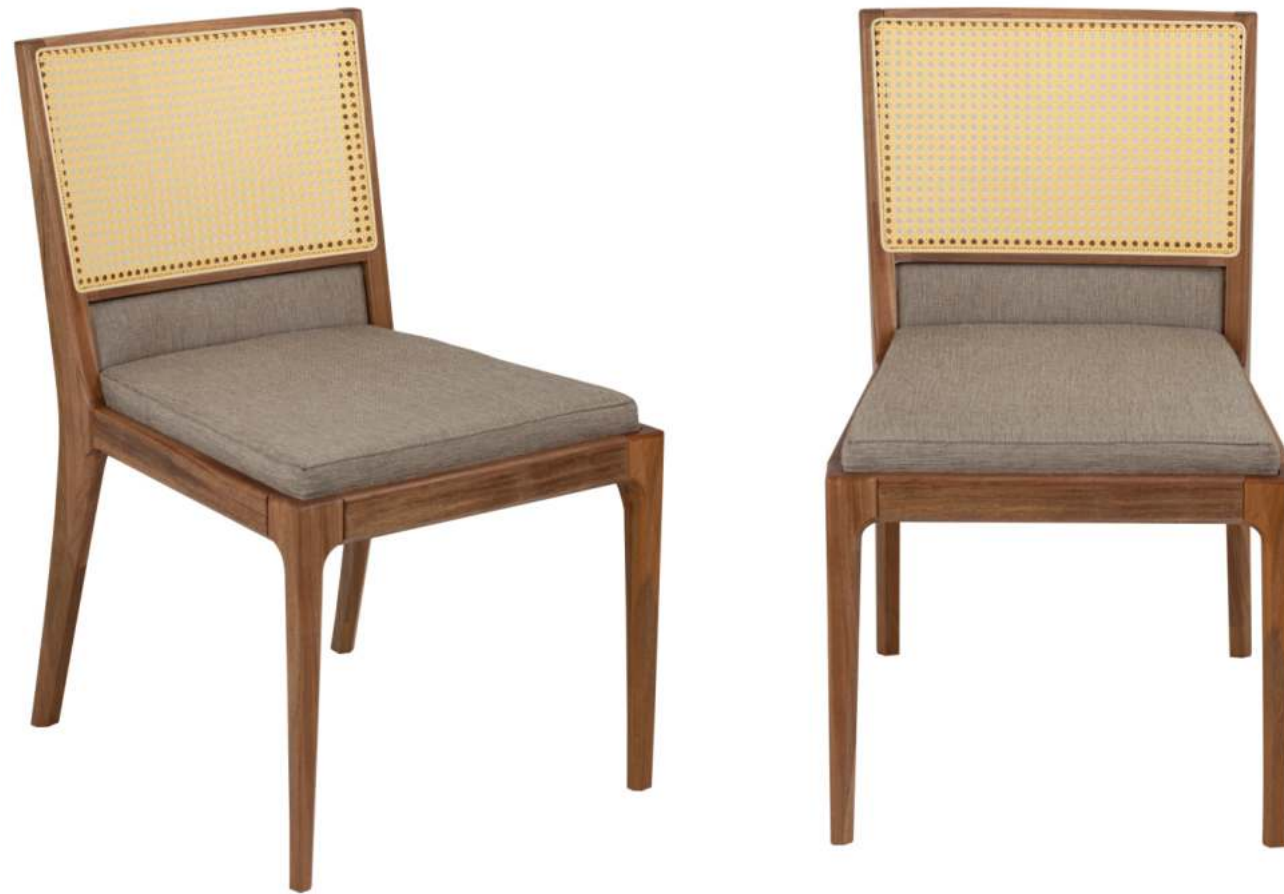
FOTO DO PRODUTO EM JEQUITIBÁ NATURAL. TECIDO 0016242. PALHA ABERTA. PICTURE UNIT IN JEQUITIBÁ WOOD. FABRIC 0016242. PEN STRAW. FOTO DEL PRODUCTO EN JEQUITIBÁ NATURAL. TEJIDO 0016242. PAJA ABIERTA.

CxPxA / medidas em mm LxDxH / measures in mm CxPxA / medidas en mm