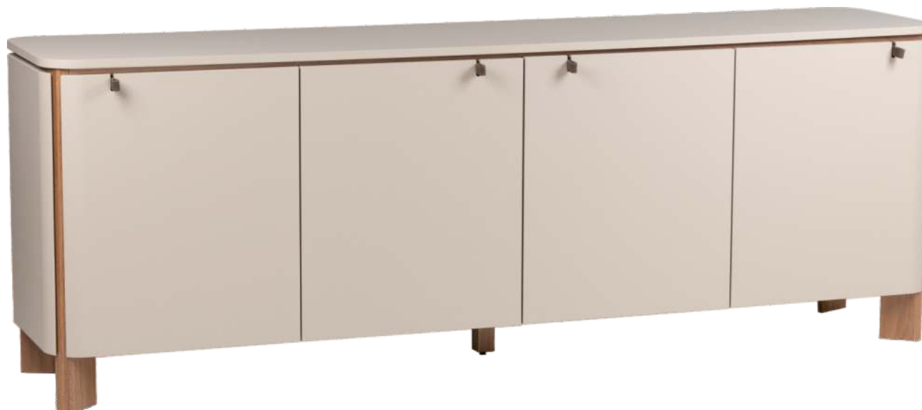
FOTO DO PRODUTO EM TRO52 PÉS EM JEQUITIBÁ NATURAL PHOTO OF THE PRODUCT IN TRO52 FEET IN JEQUITIBÁ WOOD FOTO DEL PRODUCTO EN TRO52 PIES EN JEQUITIBA NATURAL

CxPxA / medidas em mm LxDxH / measures in mm CxPxA / medidas en mm