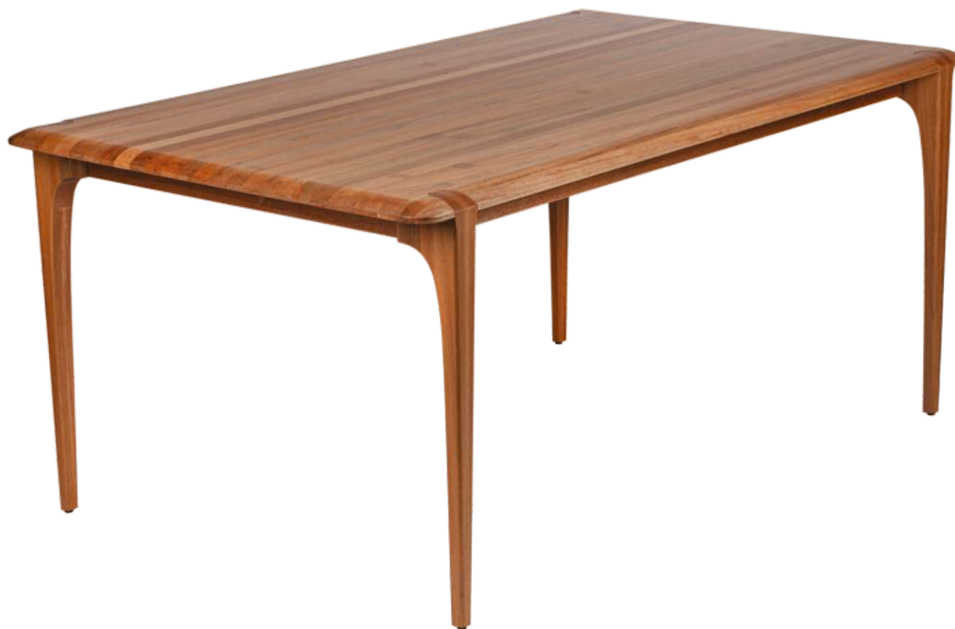
FOTO DO PRODUTO EM JEQUITIBÁ NATURAL PHOTO OF THE PRODUCT IN JEQUITIBÁ WOOD FOTO DEL PRODUCTO EN JEQUITIBÁ NATURAL