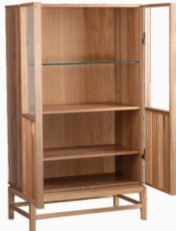
FOTO DO PRODUTO EM JEQUITIBÁ NATURAL PHOTO OF THE PRODUCT IN JEQUITIBÁ WOOD FOTO DEL PRODUCTO EN JEQUITIBÁ NATURAL