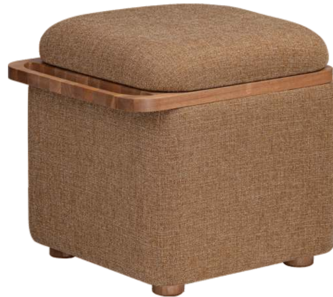
FOTO DO PRODUTO EM EM JEQUITIBÁ NATURAL. TECIDO 0062616. PICTURE UNIT IN JEQUITIBÁ WOOD. FABRIC 0062616. FOTO DEL PRODUCTO EN JEQUITIBÁ NATURAL. TEJIDO 0062616.