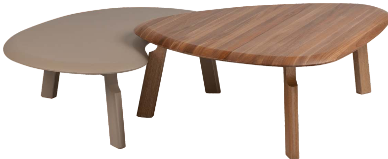
FOTO TREB2305 EM TR080 FOTO TREB2305A EM JEQUITIBÁ NATURAL PHOTO TREB2305 IN TR080 PHOTO TREB2305A IN JEQUITIBÁ WOOD FOTO TREB2305 EN TR080 FOTO TREB2305A EN JEQUITIBÁ NATURAL

CxPxA / medidas em mm LxDxH / measures in mm CxPxA / medidas en mm