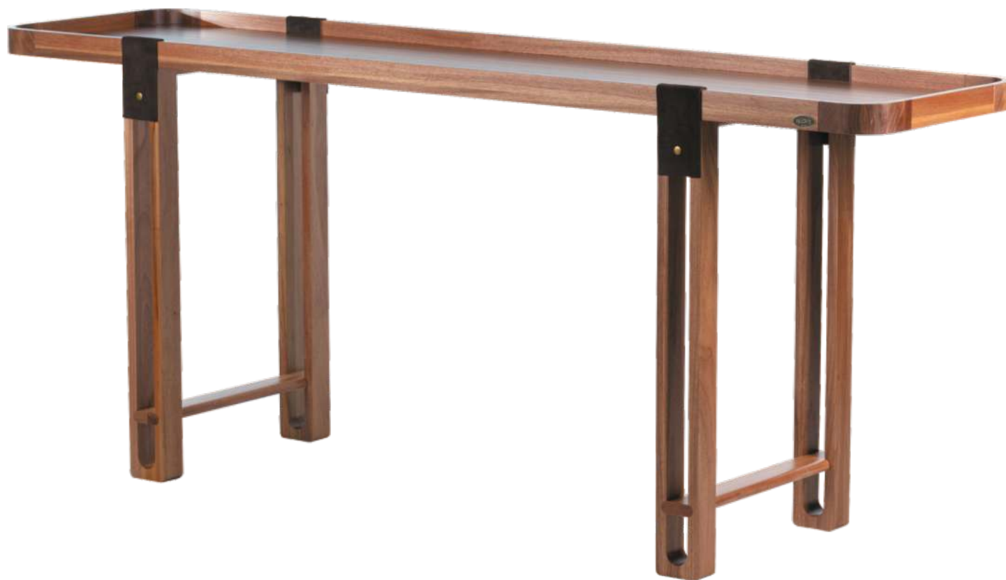
FOTO DO PRODUTO EM JEQUITIBÁ NATURAL PHOTO OF THE PRODUCT IN JEQUITIBÁ WOOD FOTO DEL PRODUCTO EN JEQUITIBÁ NATURAL

CxPxA / medidas em mm LxDxH / measures in mm CxPxA / medidas en mm