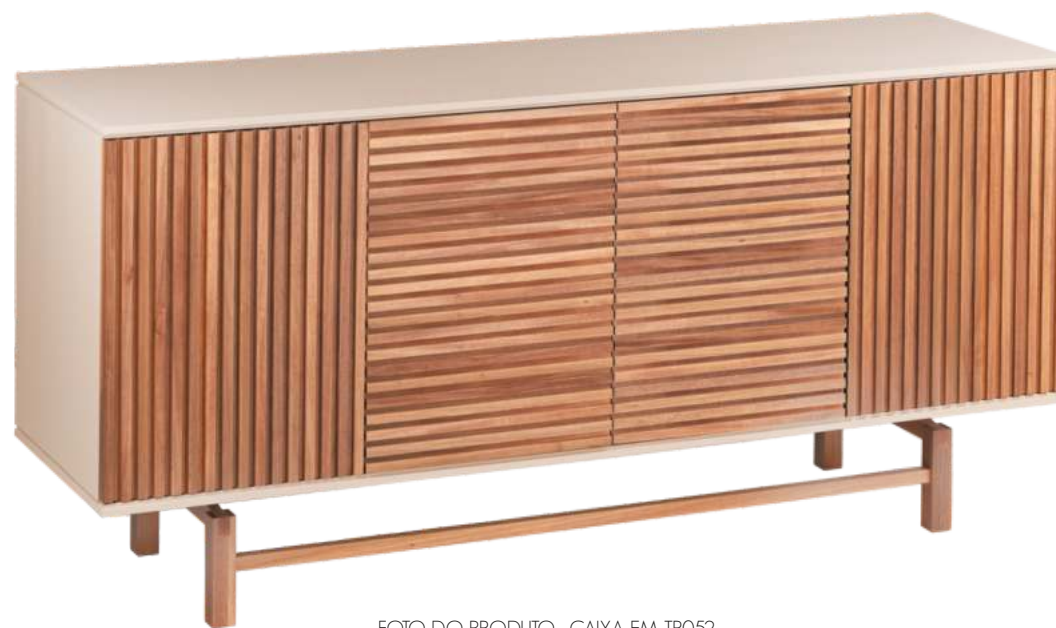
FOTO DO PRODUTO: CAIXA EM TR052, PORTAS E PÉS EM JEQUITIBÁ NATURAL PRODUCT PHOTO: BOX IN TR052, DOORS AND FEET IN WOOD JEQUITIBÁ FOTO DO PRODUCTO: CAJA EN TR052, PUERTAS Y PIES EN JEQUITIBÁ NATURAL.

CxPxA / medidas em mm LxDxH / measures in mm CxPxA/ medidas en mm