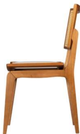
FOTO DO PRODUTO EM TRO01. TECIDO 0014877.PALHA ABERTA PICTURE UNIT IN TRO01. FABRIC 0014877.OPEN STRAW. FOTO DEL PRODUCTO DE TRO01. TEJIDO 0014877.PAJA ABIERTA.