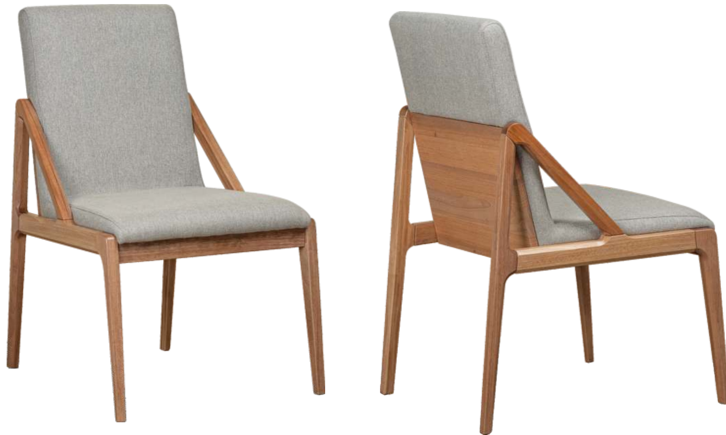
FOTO DO PRODUTO EM JEQUITIBÁ NATURAL TECIDO 0062619 PHOTO OF THE PRODUCT IN JEQUITIBÁ WOOD FABRIC 0062619 FOTO DEL PRODUCTO EN JEQUITIBÁ NATURAL TEJIDO 0062619

CxPxA / medidas em mm LxDxH / measures in mm CxPxA / medidas en mm