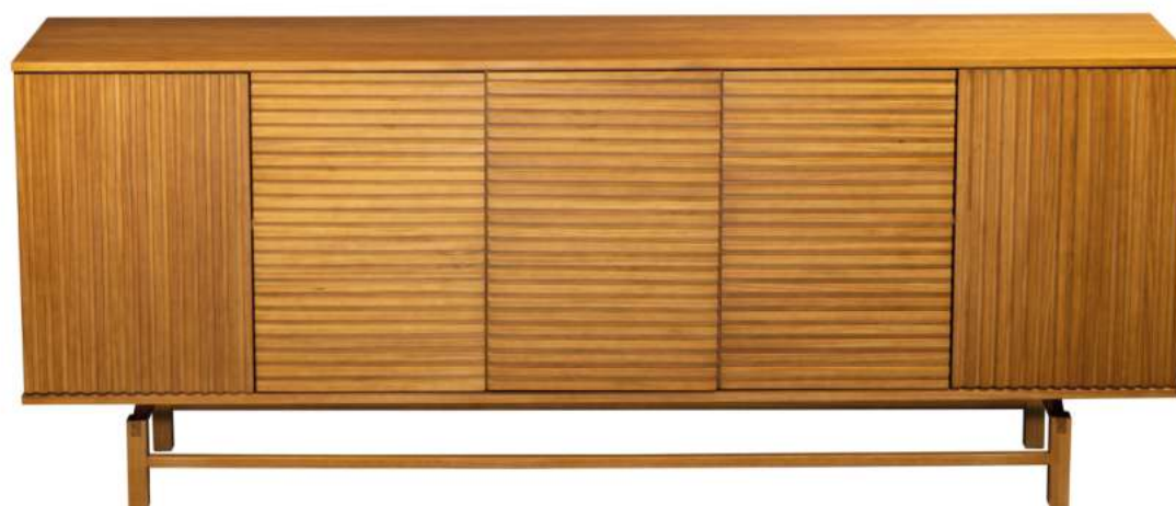
FOTO DO PRODUTO EM TR001. PRODUCT PHOTO IN TR001. FOTO DO PRODUCTO EN TR001.

FOTO DO PRODUTO: CAIXA EM TR052, PORTAS E PÉS EM JEQUITIBÁ NATURAL PRODUCT PHOTO: BOX IN TR052, DOORS AND FEET IN WOOD JEQUITIBÁ FOTO DO PRODUCTO: CAJA EN TR052, PUERTAS Y PIES EN JEQUITIBÁ NATURAL.