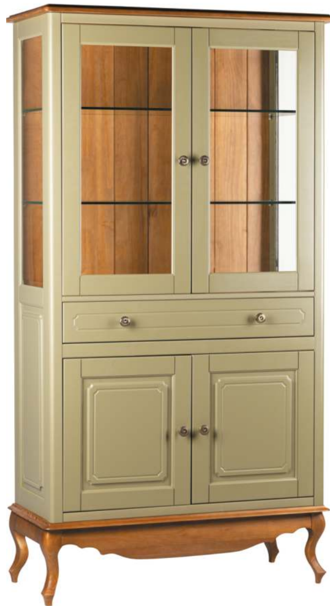
FOTO DO PRODUTO: CORPO EM TR055. PÉS, FUNDO E TAMPO EM TR036. PRODUCT PHOTO: BODY IN TR055. FEET, BACKGROUND AND TOP IN TR036. FOTO DEL PRODUCTO: CUERPO EN TR055. PIES, FONDO Y SUPERIOR EN TR036.

CxPxA / medidas em mm LxDxH / measures in mm CxPxA / medidas en mm