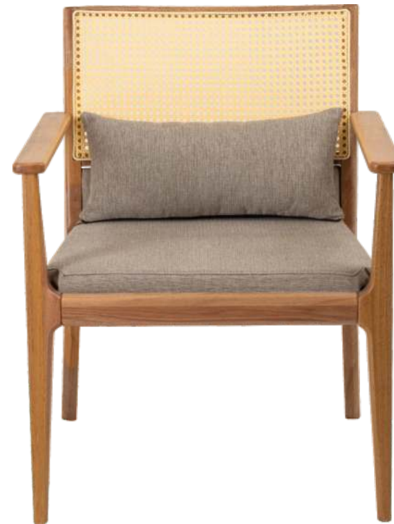
FOTO DO PRODUTO EM JEQUITIBÁ NATURAL TECIDO 0016242 PHOTO OF THE PRODUCT IN JEQUITIBA WOOD FABRIC 0016242 FOTO DEL PRODUCTO EN JEQUITIBÁ NATURAL TEJIDO 0016242