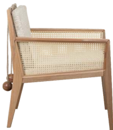
FOTO DO PRODUTO EM JEQUITIBÁ NATURAL TECIDO 0062615 PHOTO OF THE PRODUCT IN JEQUITIBÁ WOOD FABRIC 0062615 FOTO DEL PRODUCTO EN JEQUITIBÁ NATURAL TEJIDO 0062615