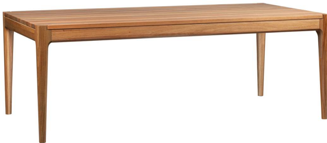
FOTO DO PRODUTO EM JEQUITIBÁ NATURAL PHOTO OF THE PRODUCT IN JEQUITIBÁ WOOD FOTO DEL PRODUCTO EN JEQUITIBÁ NATURAL

CxPxA / medidas em mm LxDxH / measures in mm CxPxA / medidas en mm