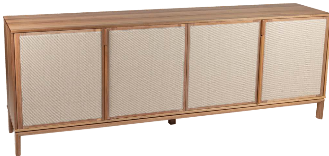
FOTO DO PRODUTO EM JEQUITIBÁ NATURAL TECIDO 0062639 PHOTO OF THE PRODUCT IN JEQUITIBÁ WOOD FABRIC 0062639 FOTO DEL PRODUCTO EN JEQUITIBÁ NATURAL TEJIDO 0062639

CxPxA / medidas em mm LxDxH / measures in mm CxPxA / medidas en mm