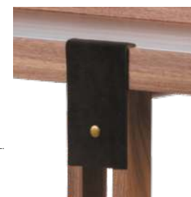
DETALHES EM COURO NATURAL DETAILS IN NATURAL LEATHER DETALLES EN CUERO NATURAL