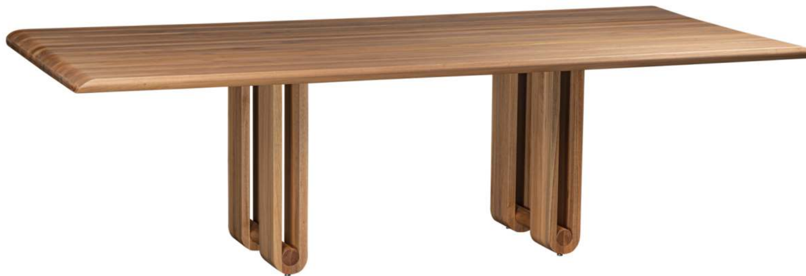
FOTO DO PRODUTO EM JEQUITIBÁ NATURAL PHOTO OF THE PRODUCT IN JEQUITIBA WOOD FOTO DEL PRODUCTO EN JEQUITIBÁ NATURAL

CxPxA / medidas em mm LxDxH / measures in mm CxPxA / medidas en mm