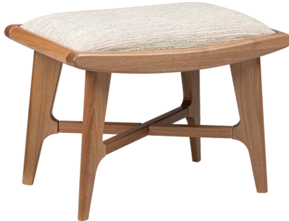
FOTO DO PRODUTO EM EM JEQUITIBÁ NATURAL. TECIDO 0062615. PICTURE UNIT IN JEQUITIBA WOOD. FABRIC 0062615. FOTO DEL PRODUCTO EN JEQUITIBÁ NATURAL. TEJIDO 0062615.

CxPxA / medidas em mm LxDxH / measures in mm CxPxA / medidas em mm