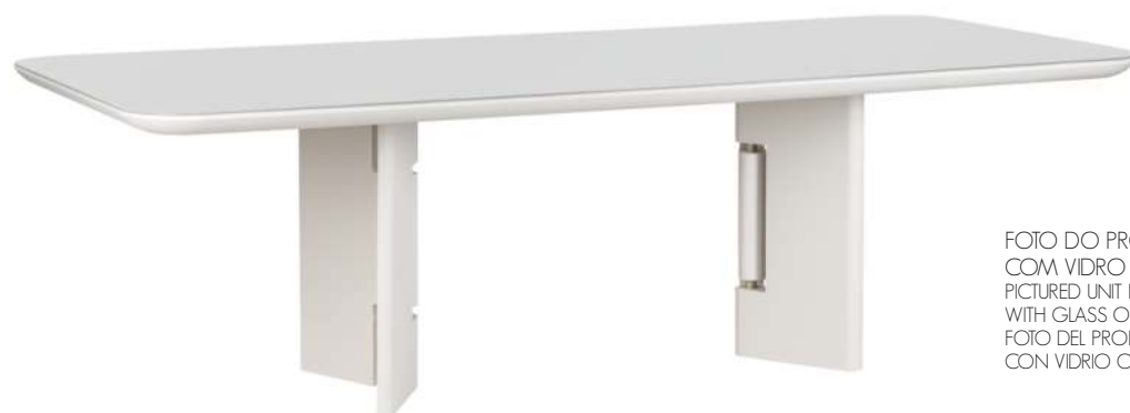
FOTO DO PRODUTO EM TR051 COM VIDRO OFF WHITE PICTURED UNIT IN TR051 WITH GLASS OFF WHITE FOTO DEL PRODUCTO DE TR051 CON VIDRIO OFF WHITE