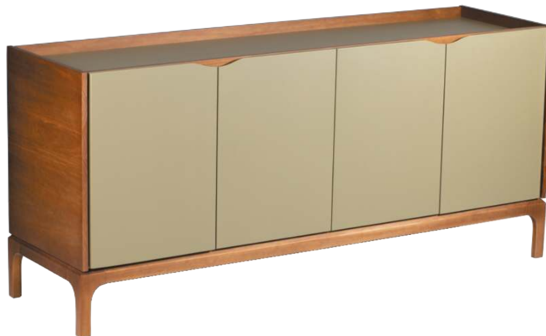
FOTO DO PRODUTO: PÉS E CORPO EM TR036. PORTAS E TAMPO EM TR055. PICTURED UNIT: DEET AND BODY IN TR036. DOORS AND TOP IN TR055 FOTO DEL PRODUCTO: PIES Y PUERTAS DE TR036. PUERTAS Y TECHO DE TR055.

CxPxA / medidas em mm LxDxH / measures in mm CxPxA / medidas en mm