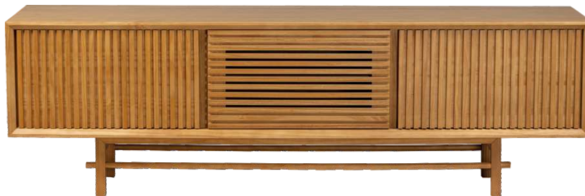
FOTO DO PRODUTO EM TR062 PHOTO OF THE PRODUCT IN TR062 FOTO DEL PRODUCTO EN TR062

FOTO DO PRODUTO: CAIXA EM TR052, PORTAS E PÉS EM TR001. PRODUCT PHOTO: BOX IN TR052, DOORS AND FEET IN TR001. FOTO DO PRODUCTO: CAJA EN TR052, PUERTAS Y PIES EN TR001.