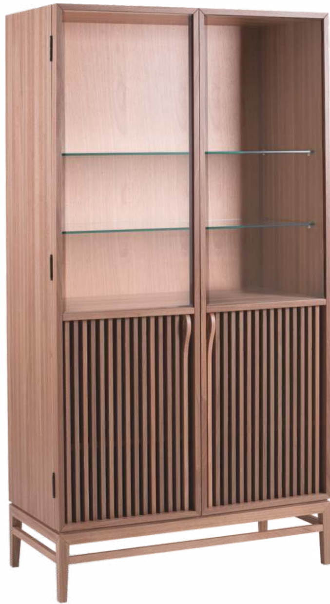
FOTO DO PRODUTO EM JEQUITIBÁ NATURAL PHOTO OF THE PRODUCT IN JEQUITIBÁ WOOD FOTO DEL PRODUCTO EN JEQUITIBÁ NATURAL

CxPxA / medidas em mm LxDxH / measures in mm CxPxA / medidas en mm