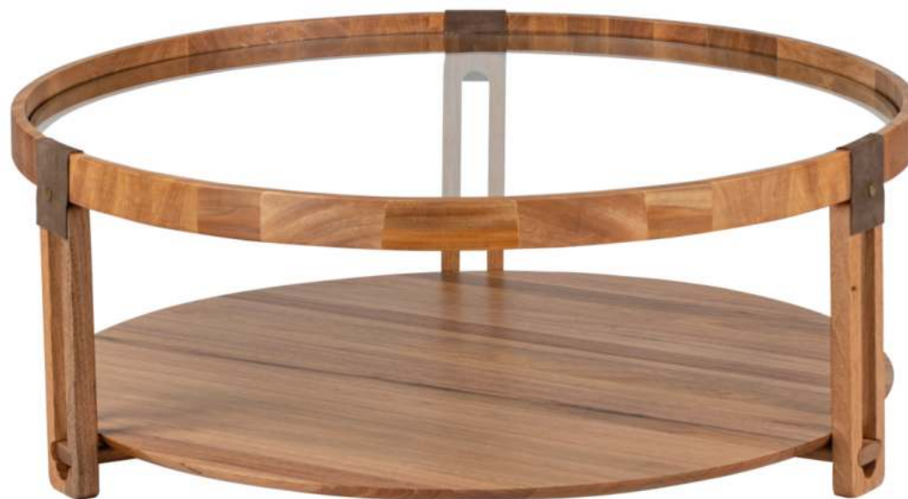
FOTO DO PRODUTO EM JEQUITIBÁ NATURAL. DETALHES EM COURO NATURAL. PHOTO OF THE PRODUCT IN JEQUITIBÁ WOOD DETAILS IN NATURAL LEATHER. FOTO DEL PRODUCTO EN JEQUITIBÁ NATURAL DETALLES EN CUERO NATURAL.

CxPxA / medidas em mm LxDxH / measures in mm CxPxA / medidas en mm