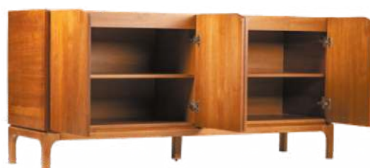
FOTO DO PRODUTO EM TR036. PHOTO OF THE PRODUCT IN TR036. FOTO DEL PRODUCTO DE TR036.