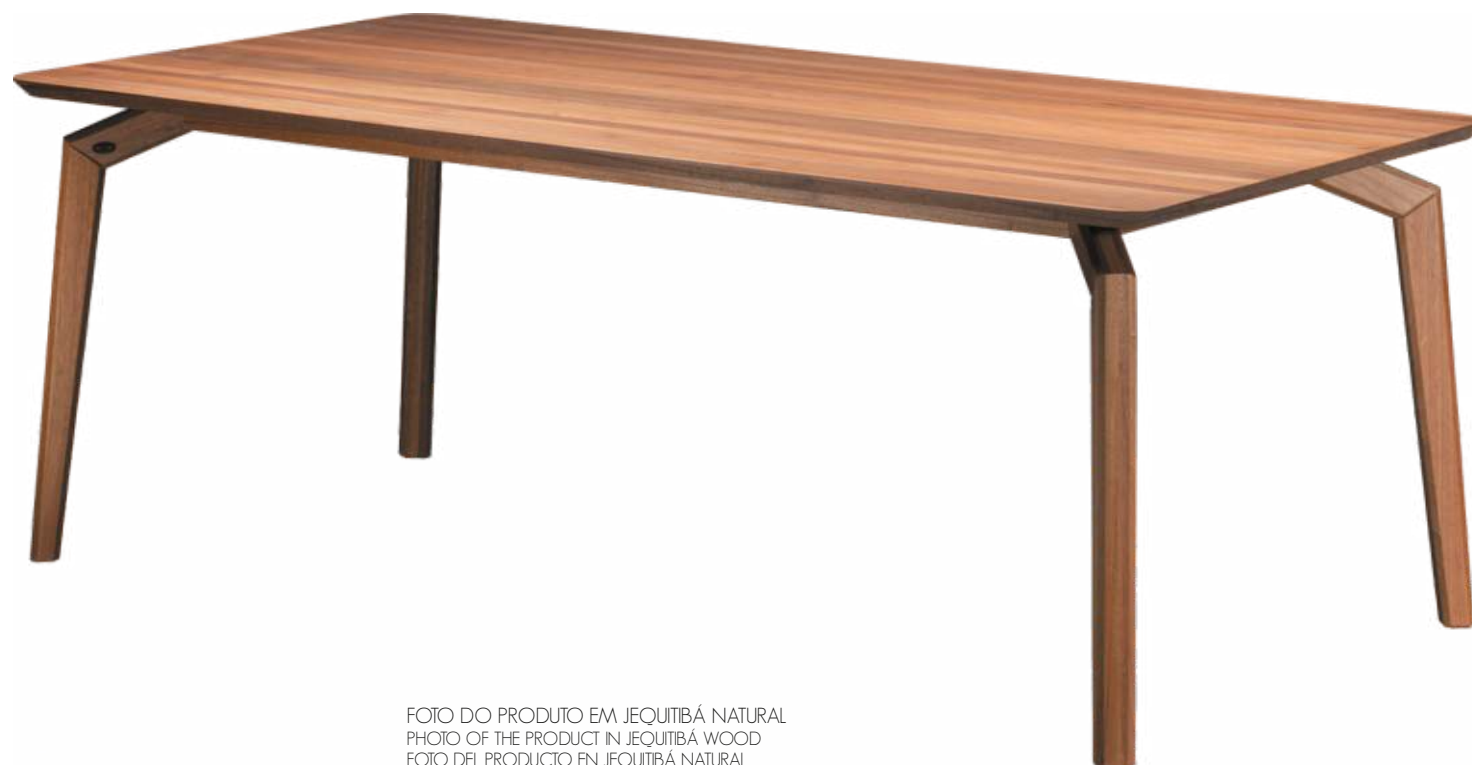
FOTO DO PRODUTO EM JEQUITIBÁ NATURAL PHOTO OF THE PRODUCT IN JEQUITIBÁ WOOD FOTO DEL PRODUCTO EN JEQUITIBÁ NATURAL

CxPxA / medidas em mm LxDxH / measures in mm CxPxA / medidas en mm