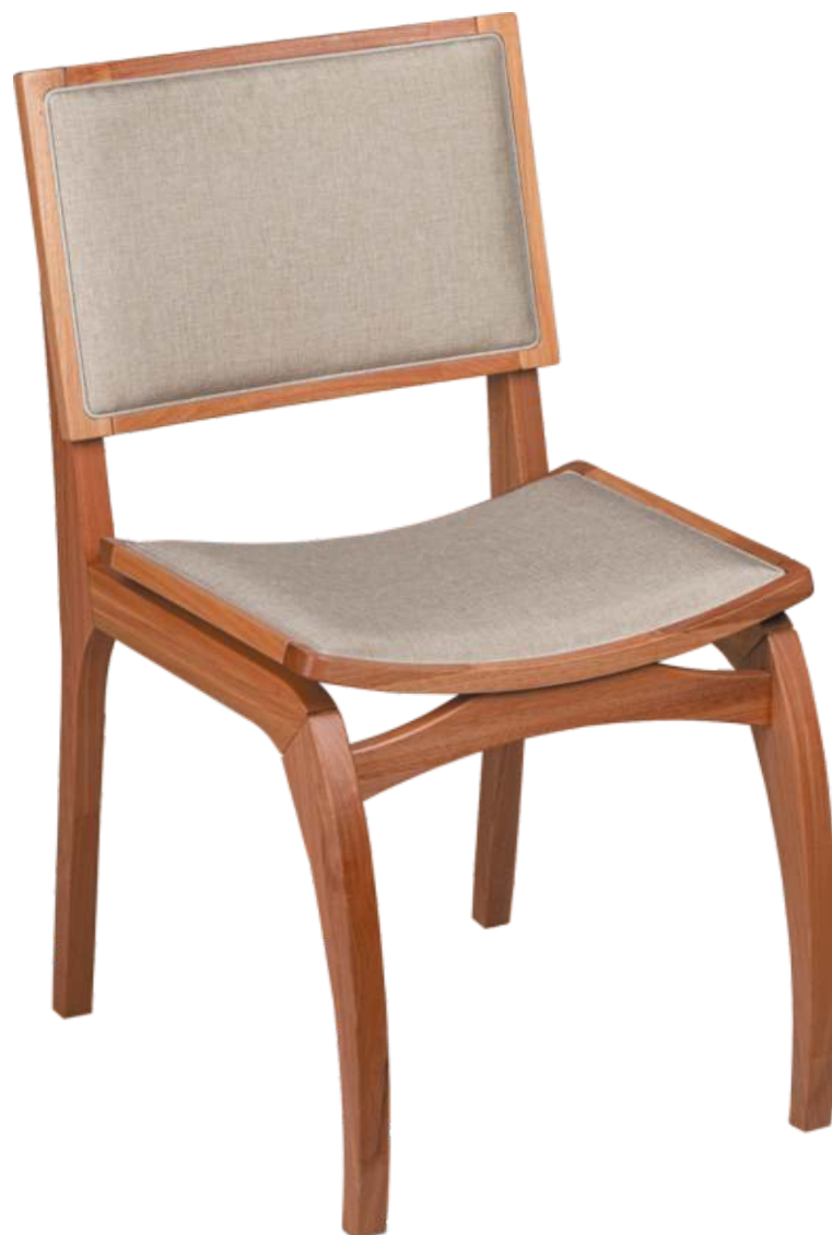
FOTO DO PRODUTO EM JEQUITIBÁ NATURAL. TECIDO 0031008 PHOTO OF THE PRODUCT IN JEQUITIBÁ WOOD. FABRIC 0031008 FOTO DEL PRODUCTO EN JEQUITIBÁ NATURAL. TEJIDO 0031008