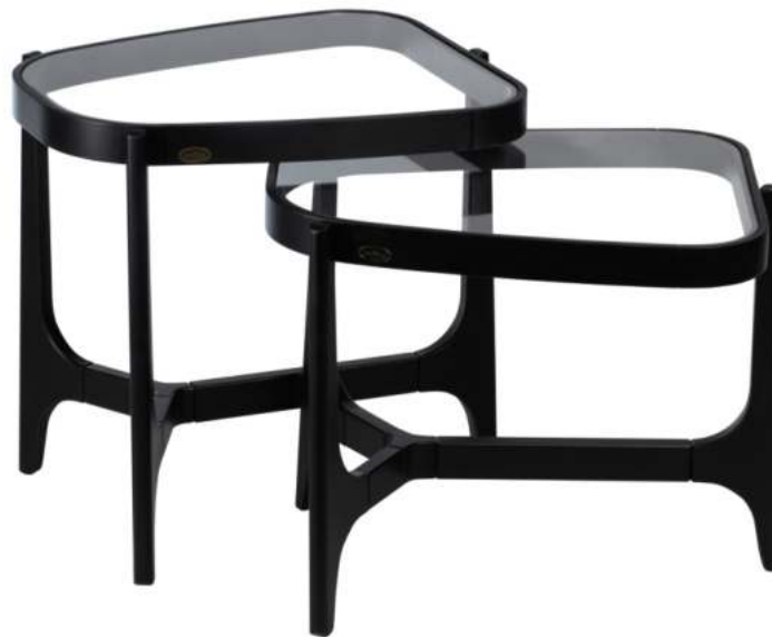
FOTO DO PRODUTO EM TR009. PHOTO OF THE PRODUCT IN TR009. FOTO DEL PRODUCTO DE TR009.

CxPxA / medidas em mm LxDxH / measures in mm CxPxA / medidas en mm