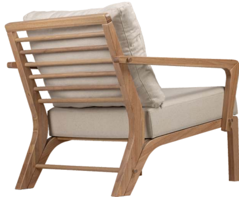
FOTO DO PRODUTO EM EM JEQUITIBÁ NATURAL. TECIDO 0031016. PICTURE UNIT IN JEQUITIBÁ WOOD. FABRIC 0031016. FOTO DEL PRODUCTO EN JEQUITIBÁ NATURAL. TEJIDO 0031016.