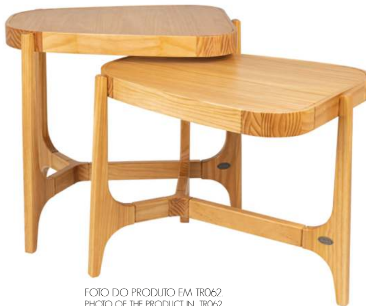
FOTO DO PRODUTO EM TR062. PHOTO OF THE PRODUCT IN TR062. FOTO DEL PRODUCTO DE TR062.