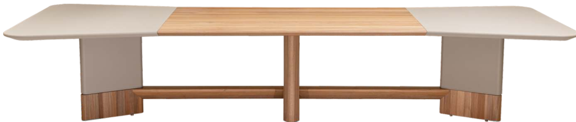
FOTO DO PRODUTO EM JEQUITIBÁ NATURAL • TR080. PHOTO OF THE PRODUCT IN JEQUITIBÁ WOOD • TR080. FOTO DEL PRODUCTO EN JEQUITIBÁ NATURAL • TR080.