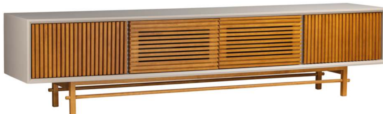
FOTO DO PRODUTO: CAIXA EM TR052, PORTAS E PÉS EM TR001. PRODUCT PHOTO: BOX IN TR052, DOORS AND FEET IN TR001. FOTO DO PRODUCTO: CAJA EN TR052, PUERTAS Y PIES EN TR001.

CxPxA / medidas em mm LxDxH / measures in mm CxPxA / medidas en mm