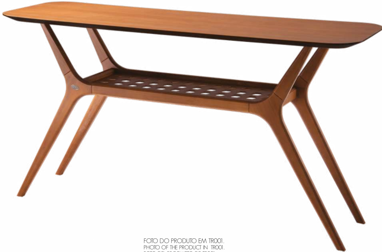
FOTO DO PRODUTO EM TRO01. PHOTO OF THE PRODUCT IN TRO01. FOTO DEL PRODUCTO DE TRO01.

CxPxA / medidas em mm LxDxH / measures in mm CxPxA / medidas en mm