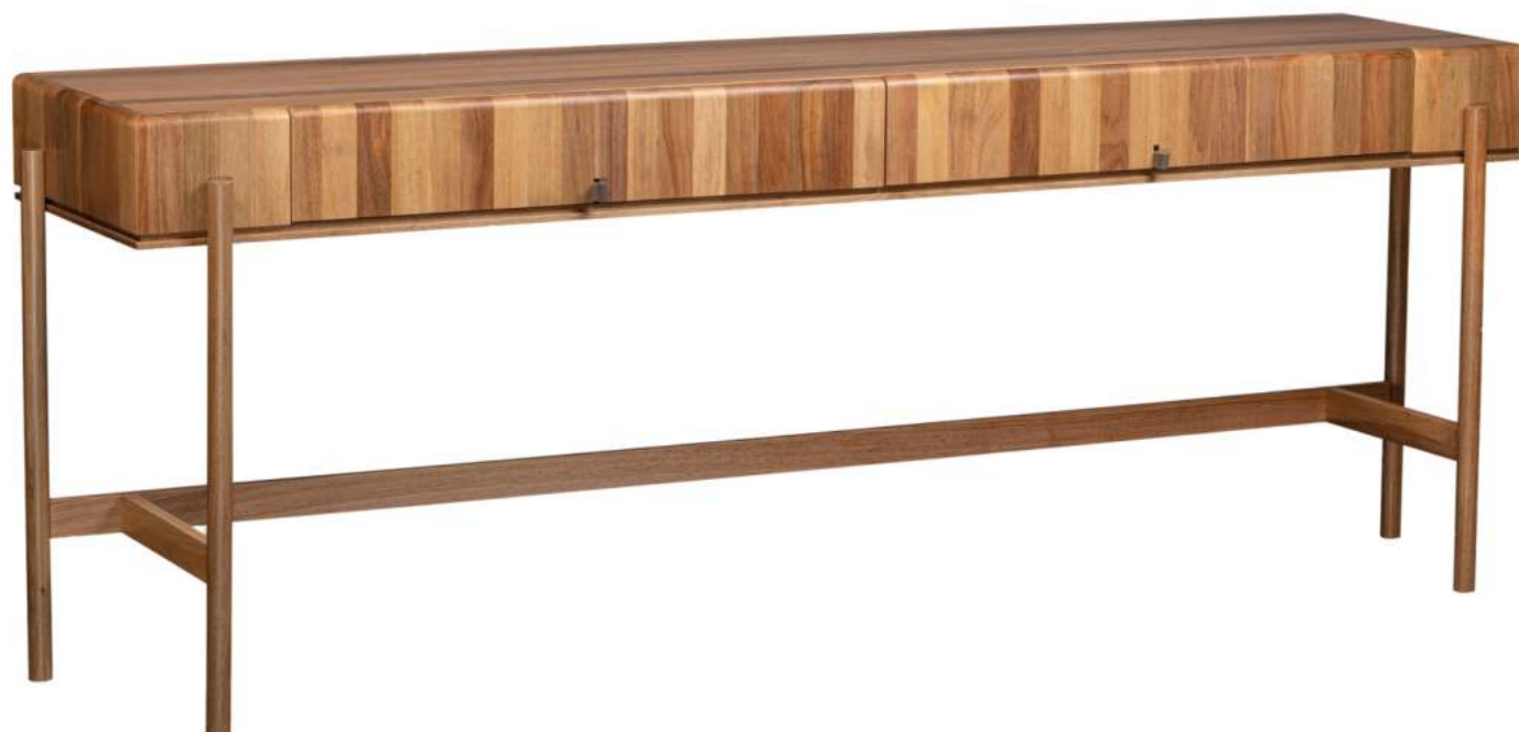
FOTO DO PRODUTO EM JEQUITIBÁ NATURAL PHOTO OF THE PRODUCT IN JEQUITIBÁ WOOD FOTO DEL PRODUCTO EN JEQUITIBÁ NATURAL