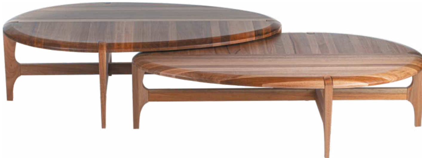
FOTO DO PRODUTO EM JEQUITIBÁ NATURAL PHOTO OF THE PRODUCT IN JEQUITIBÁ WOOD FOTO DEL PRODUCTO EN JEQUITIBÁ NATURAL

CxPxA / medidas em mm LxDxH / measures in mm CxPxA / medidas en mm