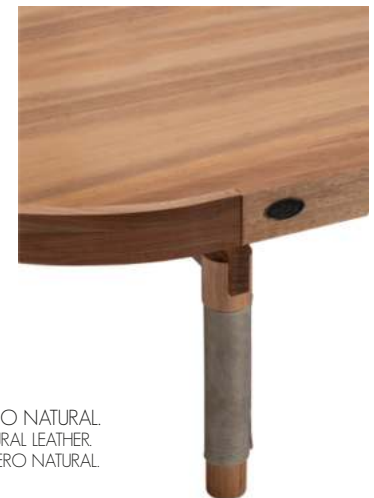
DETALHES EM COURO NATURAL. DETAILS IN NATURAL LEATHER. DETALLES EN CUERO NATURAL