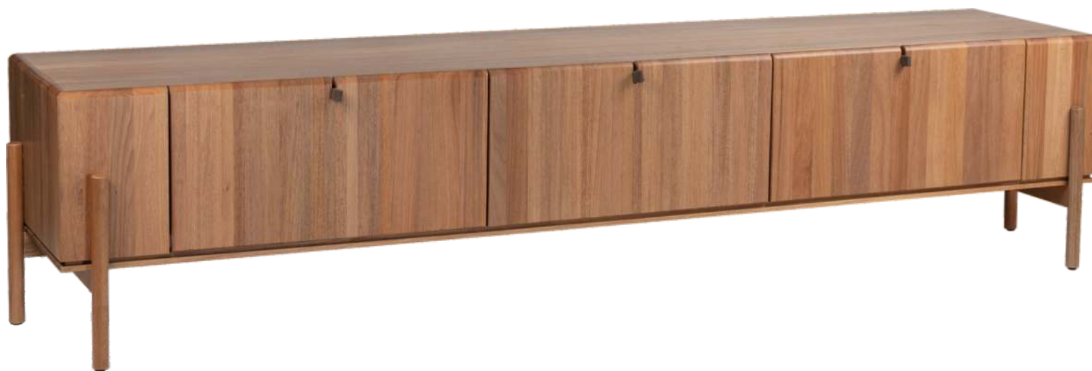
FOTO DO PRODUTO EM JEQUITIBÁ NATURAL PHOTO OF THE PRODUCT IN JEQUITIBÁ WOOD FOTO DEL PRODUCTO EN JEQUITIBÁ NATURAL

CxPxA / medidas em mm LxDxH / measures in mm CxPxA / medidas en mm