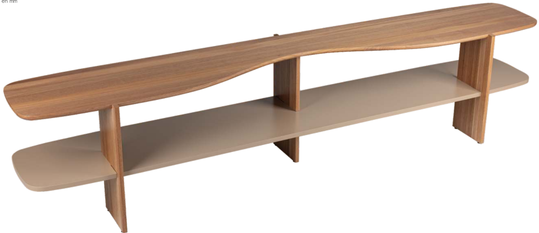
FOTO DO PRODUTO EM JEQUITIBÁ NATURAL + TR080. PHOTO OF THE PRODUCT IN JEQUITIBÁ WOOD + TR080. FOTO DEL PRODUCTO EN JEQUITIBÁ NATURAL + TR080.

CxPxA / medidas em mm LxDxH / measures in mm CxPxA / medidas en mm