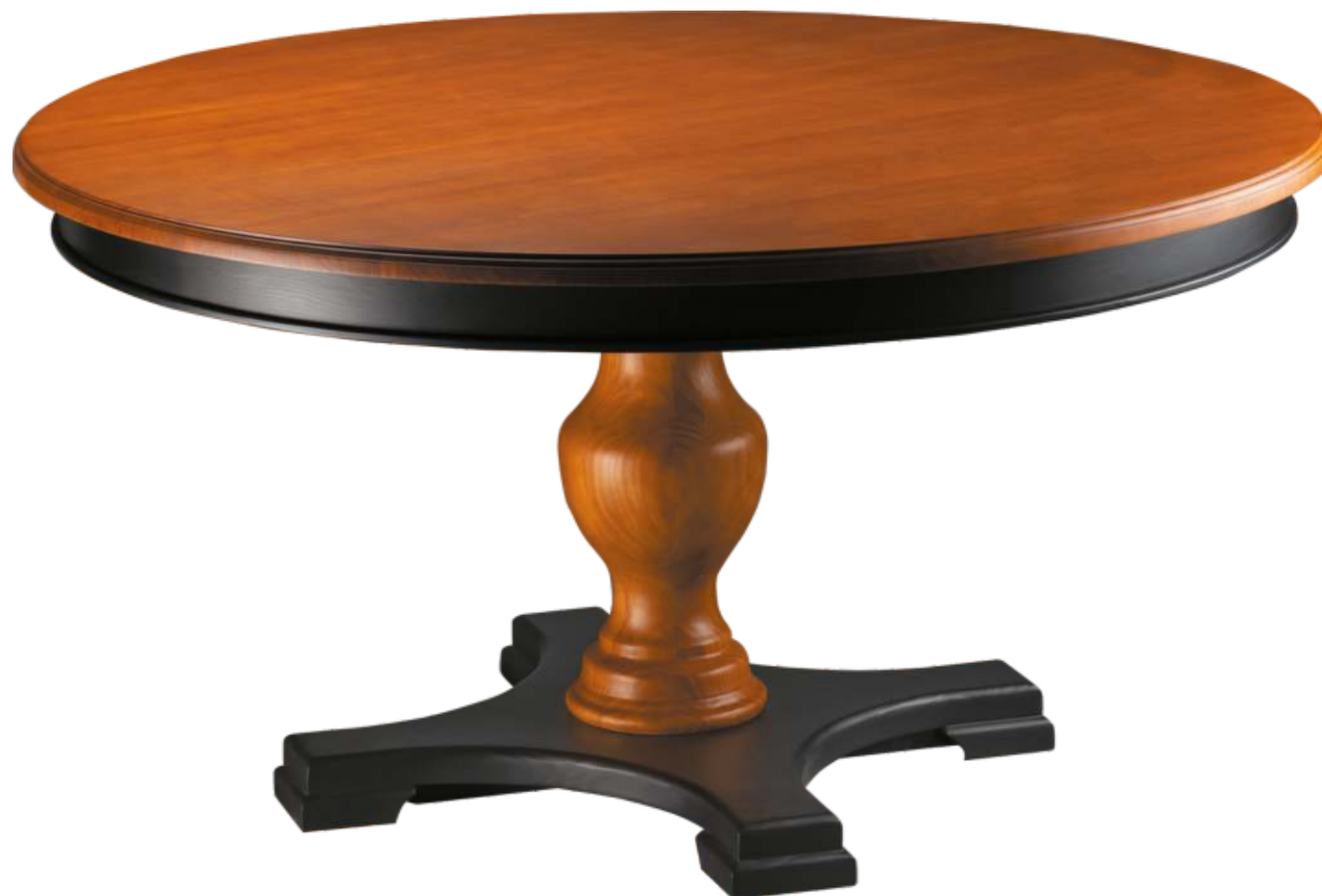
FOTO DO PRODUTO: BASE E SAIA EM TRO09. COLUNA E TAMPO EM TRO01. PICTURE UNIT: BASE AND SKIRT IN TRO09. TOP AND COLUMNAR PEDESTAL IN TRO01. FOTO DEL PRODUCTO: BASE Y ENVOLTURA DE TRO09. COLUMN Y TABLERO DE TRO01.