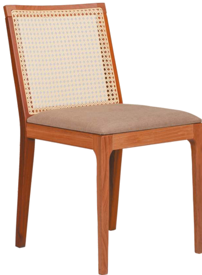
FOTO DO PRODUTO JEQUITIBÁ NATURAL TECIDO 0031017. PALHA ABERTA. PICTURE UNIT IN JEQUITIBA WOOD. FABRIC 0031017. PEN STRAW. FOTO DEL PRODUCTO EN JEQUITIBÁ NATURAL TEJIDO 0031017. PAJA ABIERTA.

CxPxA / medidas em mm LxDxH / measures in mm CxPxA / medidas en mm