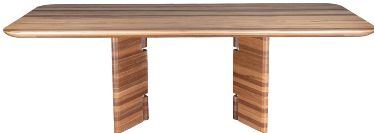
FOTO DO PRODUTO EM JEQUITIBÁ NATURAL PHOTO OF THE PRODUCT IN JEQUITIBÁ WOOD FOTO DEL PRODUCTO EN JEQUITIBÁ NATURAL

CxPxA / medidas em mm LxDxH / measures in mm CxPxA / medidas en mm